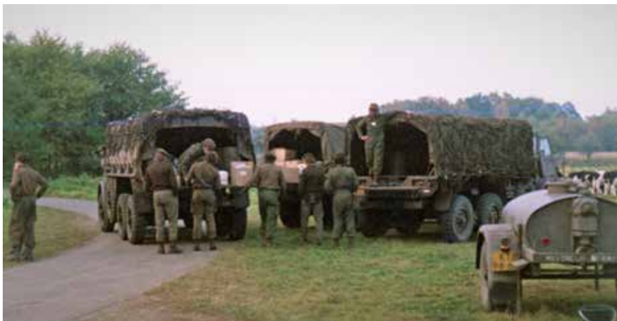
Verdeling van bataljon naar compagnieën.