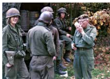
De Aal op bezoek.

Een onnavolgbare en onorthodoxe aalmoezener, maar zeer religieus, zonder flauwekul. De protestanten gingen bij voor-