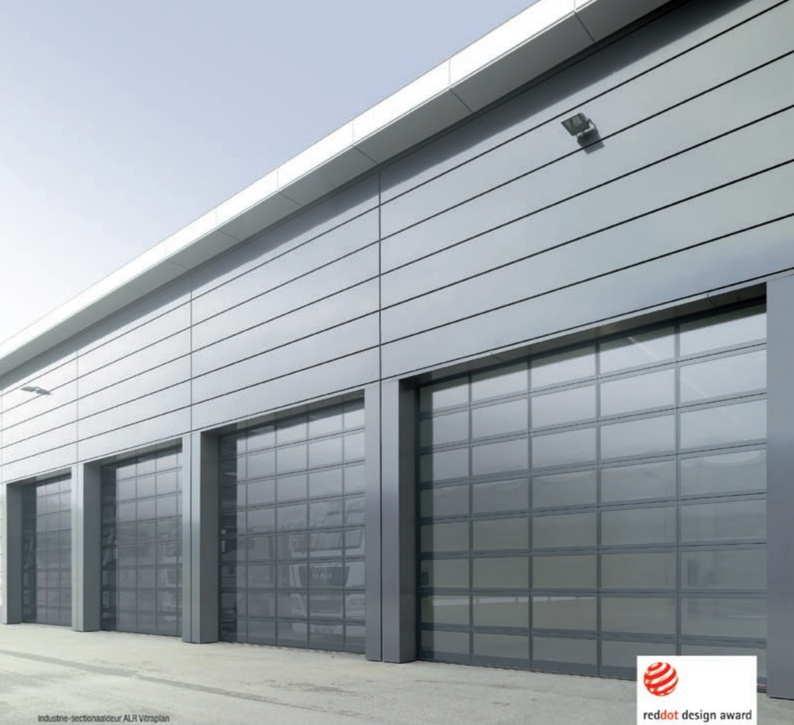
Industrie-sectionaaldeur ALR Vitraplan