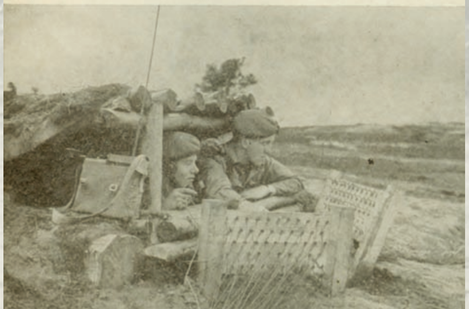
In de springput zet sergt. Harmsen de ladingen af Zijn instructies komen via de radio die door soldaat Netten wordt bedient

Bij het „doorschrijden” van vijandelijk vuur heeft men de keus uit twee methodes. De eerste is, dat de troep, zonder dat de toeschouwers dit merken, gebruik maakt van een „vuurpauze” om terrein te winnen. De commandant van de demonstrerende eenheid regelt dit geval zèlf, met de man die het vuur moet bedienen, het moment en de duur van de vuurpauze. Bij de tweede methode maakt men gebruik van witte banden (tape) welke onzichtbaar voor de toeschouwers op de heide zijn neergelegd, in diabolovorm, en waarbinnen de oprukkende troepen moeten blijven om geen hinder te ondervinden van de ontploffingen. Deze laatste methode heeft het meest realistische effect; inderdaad krijgen de toeschouwers de indruk,