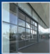
ASR 40: aluminiumdeur in fijn profielaspect

Industriedeuren en design: Bij Hörmann is dat geen tegenstrijdigheid. De industrie-sectionaaldeur ALR Vitraplan werkt door de nieuwe, in hetzelfde vlak liggende beglazing, echt hoogwaardig. En dat blijft ook zo. Daarvoor zorgt de krasvaste DURATEC kunststofbeglazing. Bekroond met de reddot Award.