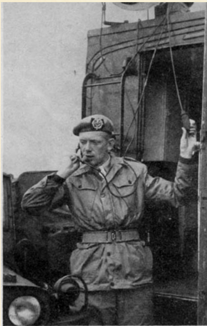
Vanuit de geluidswagen coördineert de Int. Scholts het werk van de „Vuurvoorstelling” en de aanvallende Compagnie

dat de aanvallers dwars door het vuur van de vijand naar het doel rennen. In werkelijkheid volgen ze nauwkeurig de banen, door de witte tape aangegeven en kan hun dus niets gebeuren.