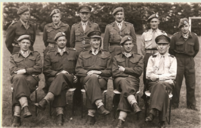
Hoofd bestuur "De Limburgse Jager" 1952