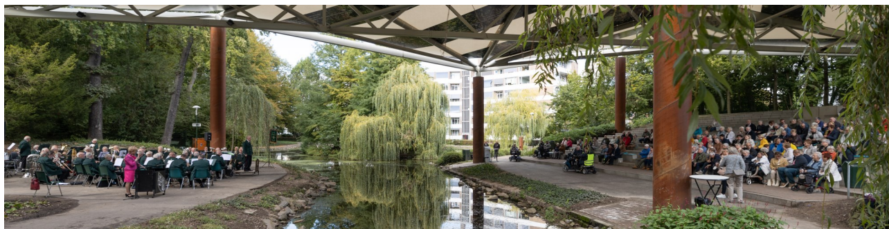
Jubileumconcert op zondag 25 september in Brunssum

In deze Nieuwsbrief leest u mooie reacties van deze drie concerten.