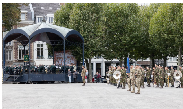
Commando-overdracht Limburgse Jagers op donderdag 15 september in Maastricht