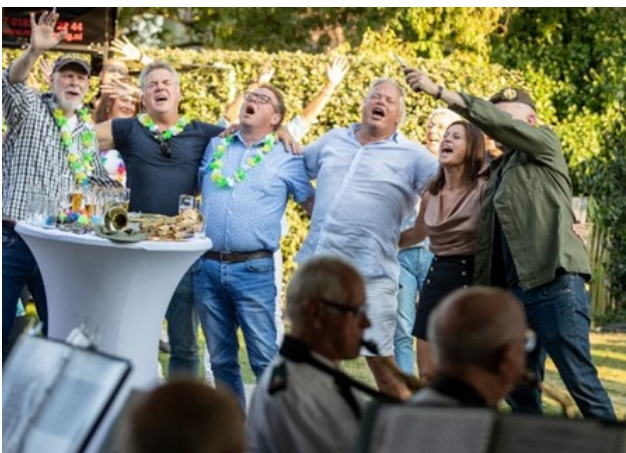
Kamertje 11 zingt mee uit volle borst