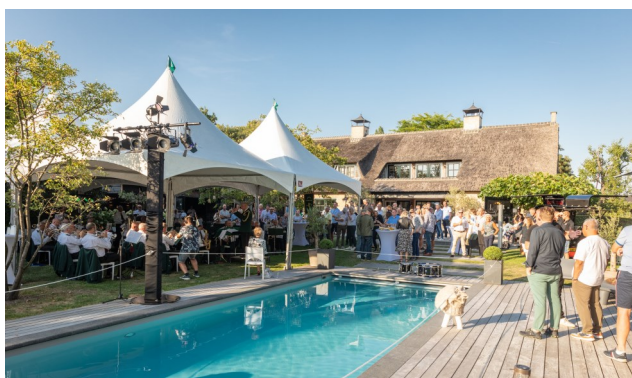
Verrassingsconcert op zaterdag 3 september in Noordeloos

De afgelopen 2 maanden gaf het ROLJ 3 geweldige concerten.