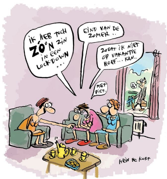
Komt goed, Riet